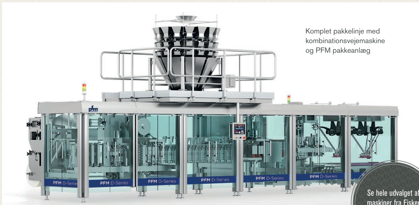
Komplet pakkelinje med kombinationsvejemaskine og PFM pakkeanlæg

Det sker med udgangspunkt i Fiskers samarbejde med udvalgte, kvalitetsleverandører hver med deres speciale og derved specialistviden. Det giver en bred, stærk vifte af produkter, som Fisker sammensætter til kundespecifikke produktionsanlæg, som præcist opfylder jeres behov.